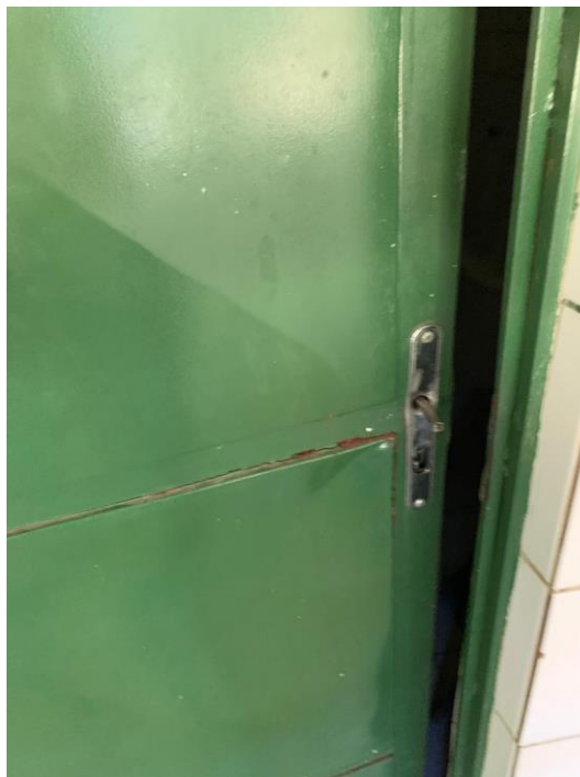
Foto 08 – Algumas portas danificadas, com sinais de arrombamento;