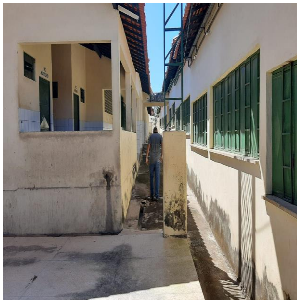
Foto 02 – Corredor externo com infiltrações no piso e nas paredes;