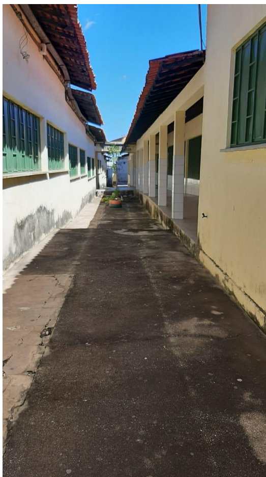
Foto 01 – Localização da fossa séptica e sumidouro existentes no corredor entre o pátio de entrada e as salas de aula;