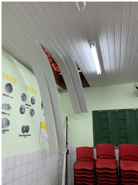
Foto 12 – Algumas salas de aula necessitam de intervenção parcial ou total no forro de pvc;