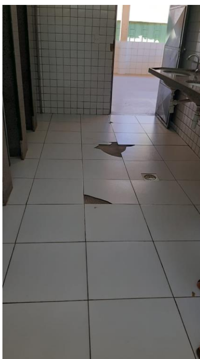
Foto 05 - Peças cerâmicas danificadas no piso do banheiro.