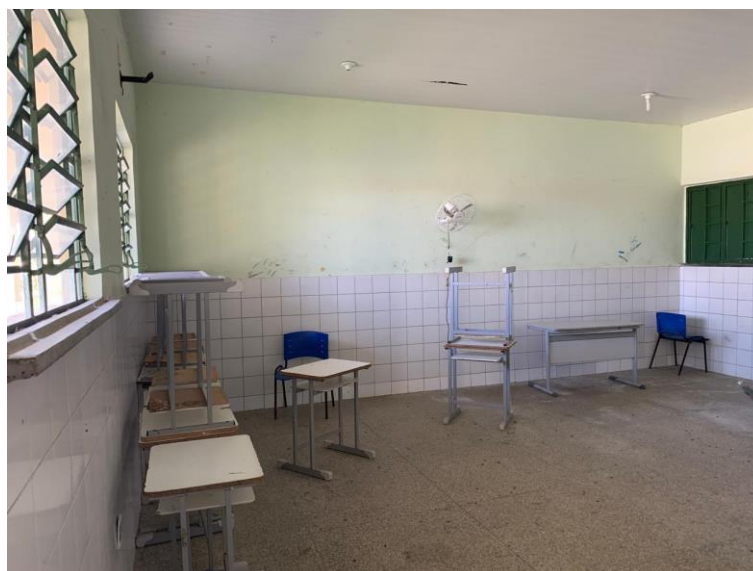
Foto 11 – Algumas salas de aula necessitam de intervenção parcial no piso; paredes com pintura desgastada;